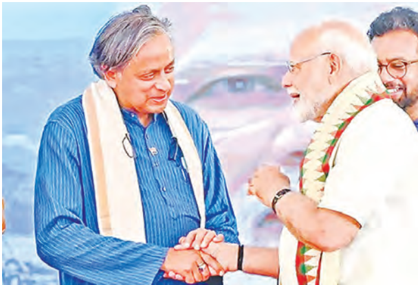
प्रणालियों पर गौरव बहाल करने के लिए 10 साल के राष्ट्रीय मिशन की अपील की। कुल मिलाकर, प्रधानमंत्री के संबोधन ने एक आर्थिक दृष्टिकोण और एक सांस्कृतिक आह्वान, दोनों का काम किया, जिसमें राष्ट्र को प्रगति के लिए बेचैन रहने का आह्वान किया गया। सदी-नुकाम से जुड़ने के बावजूद दर्शकों के बीच मौजूद रहकर खुशी हुई!